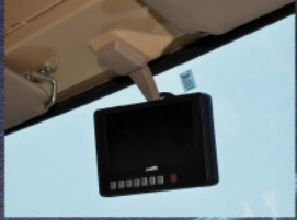
既存ルームミラースペースへの取付けも可能