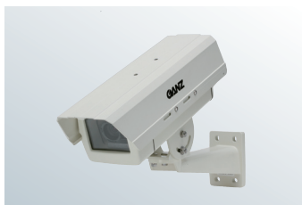
壁面取付屋外ハウジング (ZH-CP2-W) ※壁面取付金具付属