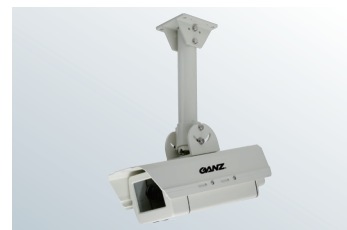
天井取付屋外ハウジング (ZH-CP2-H) ※天井吊下金具付属