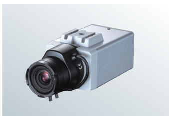
ダミーカメラ (ZC-YH214MM) ※ダミーレンズ別売